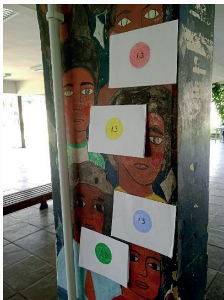
Figura 1. Enigmas postos em um pilar.

pilares numerados. A numeração dos pilares não dizia a ordem a serem respondidas as questões. Ao responderem a questão com a qual se depararam, os grupos eram guiados a outra, até que resolvessem um total de 5. Caso a resposta escolhida fosse a errada, seriam direcionados a um pilar com um papel escrito “Parece que sua resposta estava errada, volte e tente novamente”; caso a resposta estivesse correta, o grupo seria direcionado à questão seguinte. Os grupos, predeterminados pelos professores, precisavam responder às mesmas 5 questões (em ordens diferentes), sendo guiados para partes diferentes do ambiente. Os alunos poderiam ter acesso ao recurso bússola, que consistia em uma dica sobre a questão e poderia ser usado uma única vez a cada questão. Ganharia o primeiro grupo que acertasse todas as questões, ou aquele que estivesse mais perto do fim do labirinto, no final do tempo. O material utilizado na construção dos enigmas foi papel A4, caneta esferográfica e lápis de cor. O papel, em pé, foi dobrado ao meio e a parte interna superior possuía o número e o comando da questão, enquanto na parte inferior havia as alternativas, já com o direcionamento ao lado. Na parte frontal, com o papel dobrado, estava escrito o número de identificação do pilar, dentro de um círculo pintado com a cor da equipe.