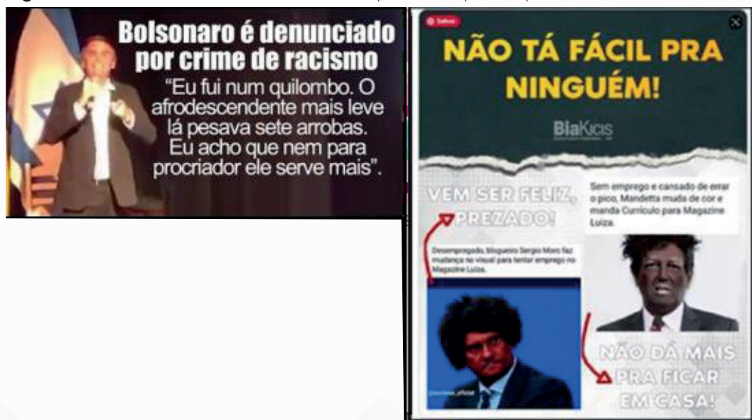
Figura 1 — Fala do ex Presidente Bolsonaro e piada feita pela Deputada Bia Kicis