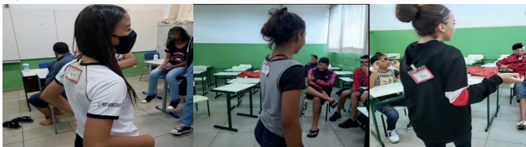
Figura 4 — Momento da ação com os estudantes