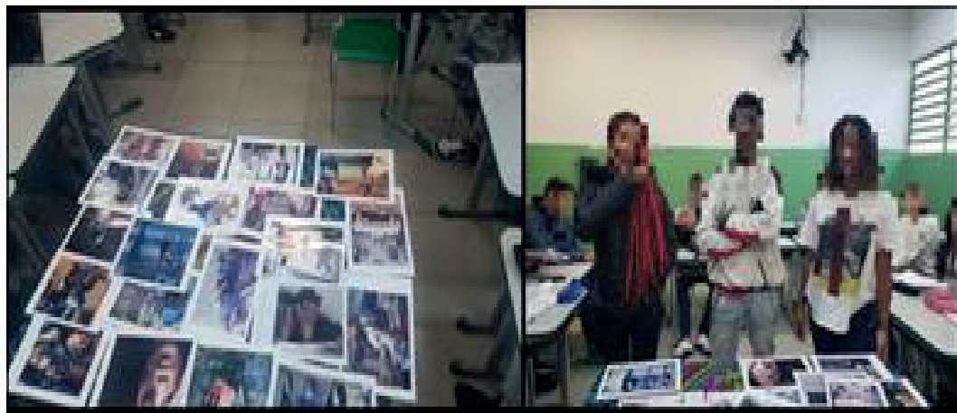
Figura 3 — Momento da ação com os estudantes

Tal situação é evidenciada por Munanga (2004, p. 52), ao dizer que no Brasil não é fácil definir quem é negro e que não é, uma vez que “[...] há pessoas negras que introjetaram o ideal de branqueamento e não se consideram como negras. Assim, a questão da identidade do negro é um processo doloroso”, como pode ser evidenciada nos dados apresentados no quadro sobre a autodeclaração dos estudantes.