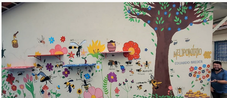
Figura 3 – Resultado da montagem do meliponário pelos alunos