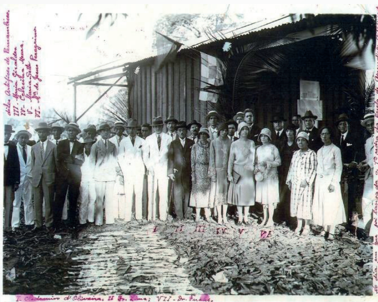
Fig. 1: Lançamento a pedra fundamental em 1930

Com obras concluídas em 1934, o edifício foi ocupado pela escola ainda em fase de construção, no ano de 1933. Retornava assim ao Derby, novamente às margens do rio Capibaribe. A condição de um edifício ainda inacabado pode ser observada na fotografia abaixo (Fig. 2), publicada naquele ano no jornal escolar O Artífice , impresso produzido pela