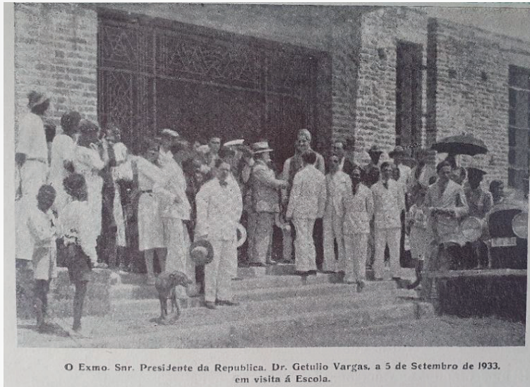
Fig. 2: Visita do presidente Getúlio Vargas à EAAPE em 1933

seção de Artes Gráficas da própria instituição, que mostra também a visita do então presidente Getúlio Vargas à escola.