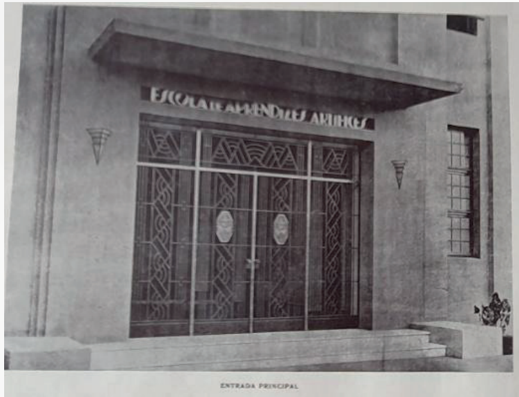
Fig. 4: Entrada principal da Escola de Aprendizes Artífices de Pernambuco

a entrada principal da Escola de Aprendizes Artífices de Pernambuco em evidência.