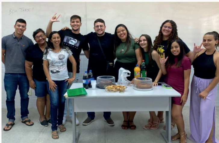
Figura 4 – Integração entre ensino, pesquisa e extensão: encerramento dos cursos de Libras na UFERSA (2023).