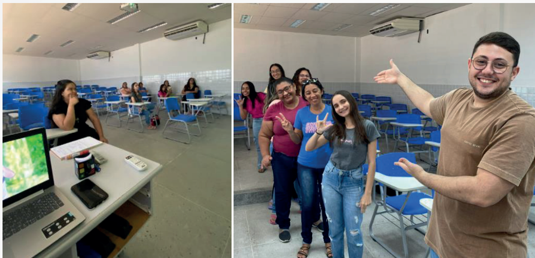
Figura 1 – Práticas pedagógicas desenvolvidas no curso de Libras Básico (UFERSA, 2023).