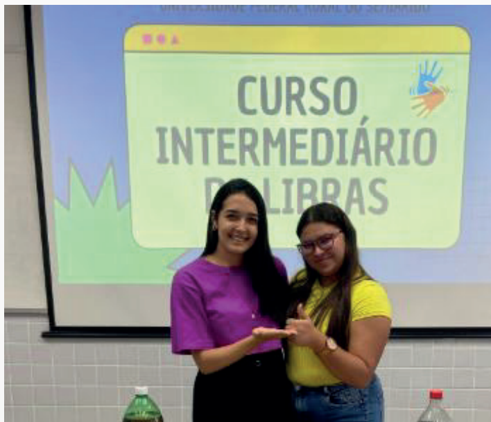
Figura 2 – Projeto de extensão “Curso Intermediário de Libras” realizado na UFERSA (2023).

Além disso, os projetos de extensão criam um ambiente propício à aprendizagem significativa, onde o conteúdo teórico ganha vida nas experiências práticas. Os participantes aprendem a reconhecer a Libras não apenas como uma disciplina, mas como uma forma legítima de expressão e comunicação. Essa vivência contribui para o desenvolvimento de competências interculturais, ampliando o olhar crítico dos alunos sobre a diversidade e a equidade linguística.