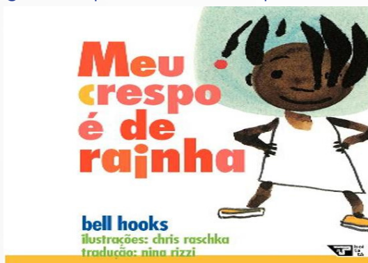
Figura 2: Capa do livro Meu crespo é de rainha