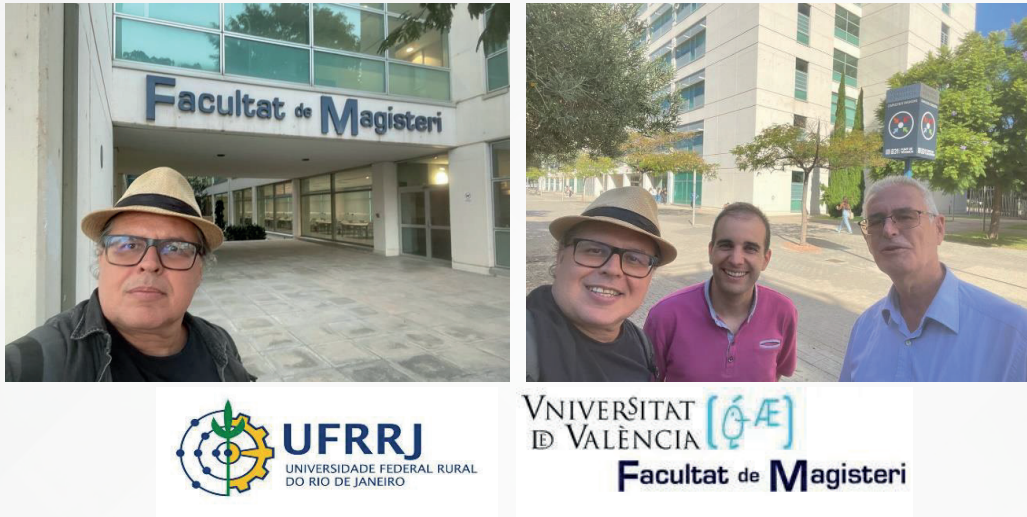
Figura 01. Facultat de Magisteri da Universitat de València