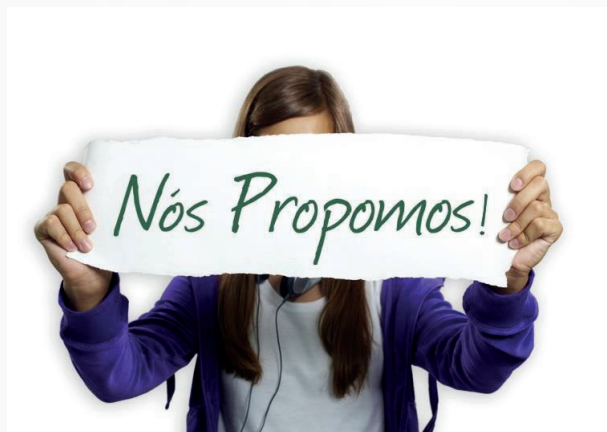
Figura 02. Logo do Nós Propomos!

A Rede Internacional Nós Propomos! Cidadania e Inovação na Educação Geográfica (Veja logo da rede na figura 02) é um projeto educacional que visa estimular a participação dos estudantes no planejamento urbano e na resolução de problemas locais a partir do ensino de Geografia.