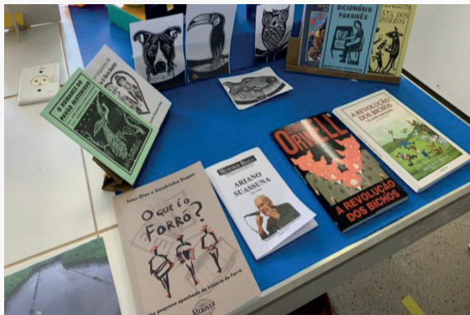
Figura 02 - Materiais de literatura de cordel utilizados como referências durante o projeto