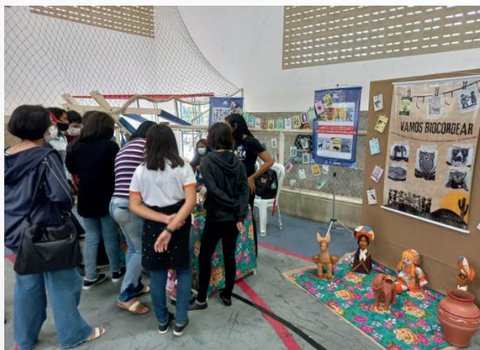
Figura 03 - Alunos visitando o stand do projeto no ginásio do CES/UFGC

Continuando com a Programação do Festival, durante o segundo dia do evento, o projeto teve sua exposição no ginásio do CES, ambiente com stands destinados apenas aos trabalhos de extensão (Figura 03).