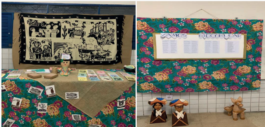
Figura 06 - Stand do Projeto de Extensão na Feira de Ciências com exposição do cordel coletivo produzido pelo Projeto de Extensão