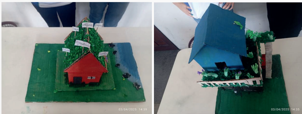
Fig. 3: Maquetes de Telhados Verdes reutilizando materiais

A Fig. 3 apresenta duas maquetes de demonstração de telhados verdes, desenvolvidas como parte das atividades práticas do projeto. A primeira maquete utiliza o espaço da varanda, representando um telhado alternativo, enquanto a segunda foi elaborada simulando a aplicação do telhado verde sobre o próprio telhado principal da construção.