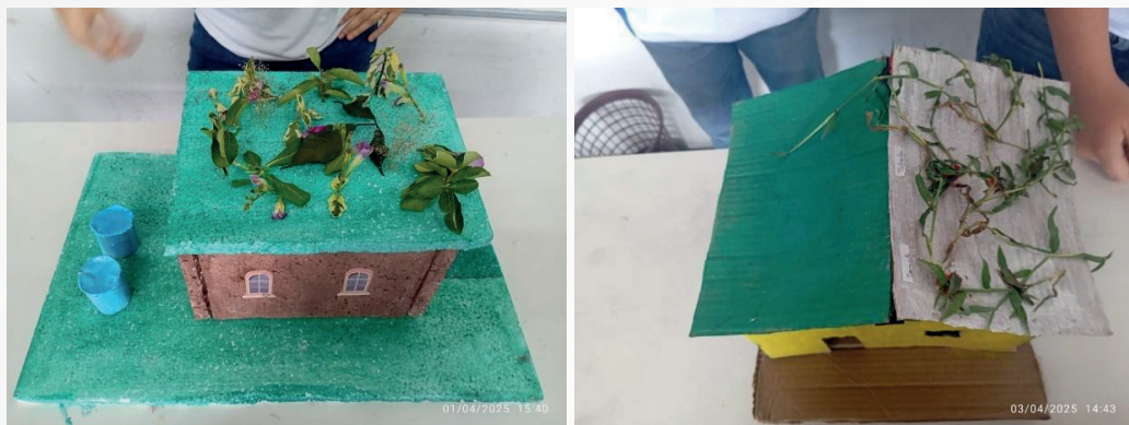
Fig. 1: Maquetes dos Telhados Verdes com vegetação natural