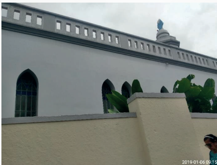
Figura 3 - Parte da bela Capela de Nossa Senhora das Graças do Instituto Maria Imaculada.

truíram as salas de aulas, dormitório para as alunas que estudaram em regime de internato etc. O Instituto Maria Imaculada antigamente era chamado de Patronato da Imaculada Conceição. Foi possível perceber a existência de arvores entre o muro que separa o Instituto Maria Imaculada da rua onde transitam os veículos. Também foi possível perceber a existência da imagem de Nossa Senhora das Graças sobre a torre da Capela de Nossa Senhora das Graças do Instituto Maria Imaculada.