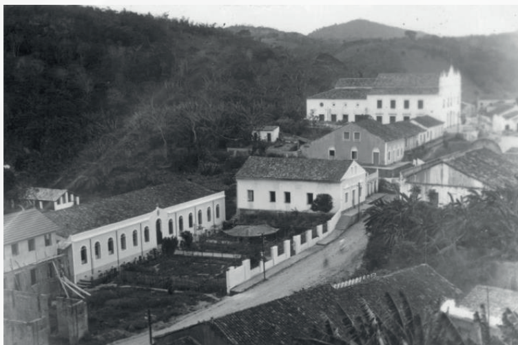
Figura 16 - Colégio Patronato Imaculada Conceição de Pacoti.