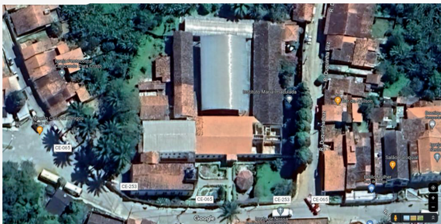
Figura 1 - Instituto Maria Imaculada, na cidade de Pacoti.