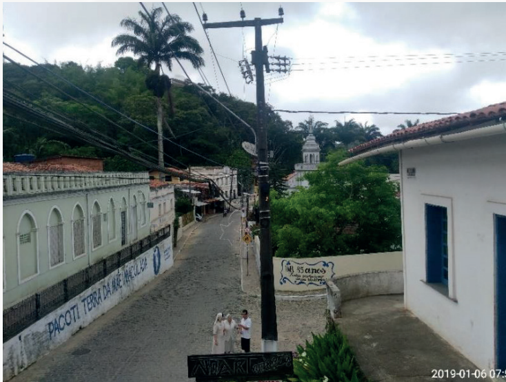
Figura 9 - Pacoti Terra da Mãe Imaculada.