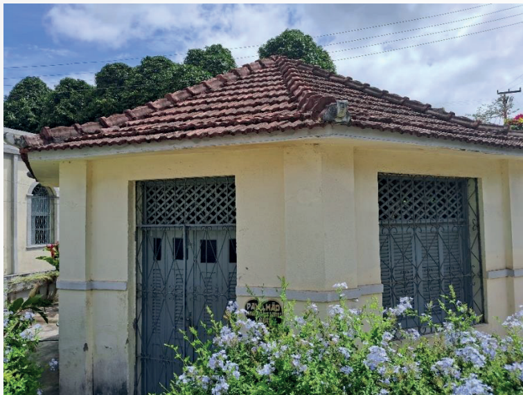
Figura 12 – Pavilhão Dona Doninha dos Santos Arruda.