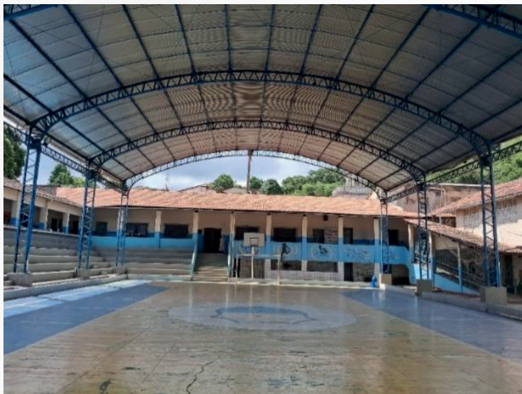
Figura 17 - Quadra esportiva que fica localizada internamente no Instituto Maria Imaculada.