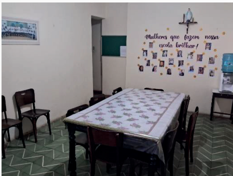
Figura 22 - Sala dos professores do Instituto Maria Imaculada.

A Figura 22 mostra a sala dos professores do Instituto Maria Imaculada, onde abaixo em um altar tem uma imagem de Nossa Senhora existem uma frase “Mulheres que fazem nossa escola brilhar”. Vale ressaltar que a mesa e as cadeiras da sala dos professores são muito antigas.