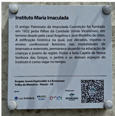
Figura 2 – Placa com a história do Instituto Maria Imaculada.