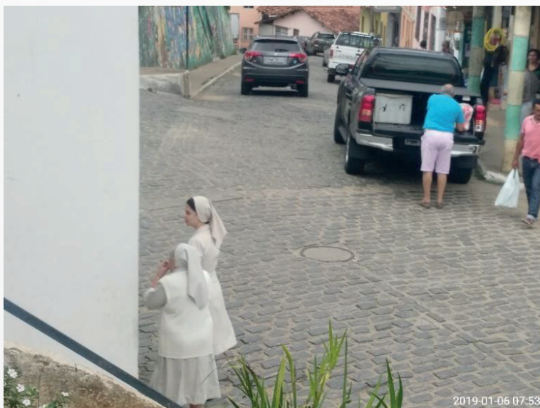
Figura 7 - Duas freiras de hábito religioso do Instituto Maria Imaculada.

Devido ao uso e ocupação do solo, ou seja, o aumento da população e da cidade de Pacoti o Instituto Maria Imaculada dentro da zona urbana, ou seja, no centro da cidade de Pacoti.