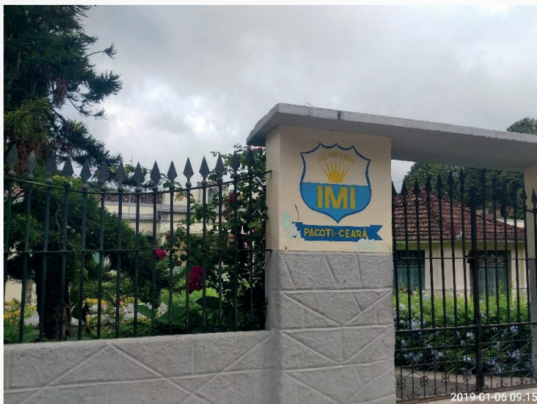
Figura 4 - Portão de entrada do Patronato da Imaculada Conceição (Instituto Maria Imaculada).