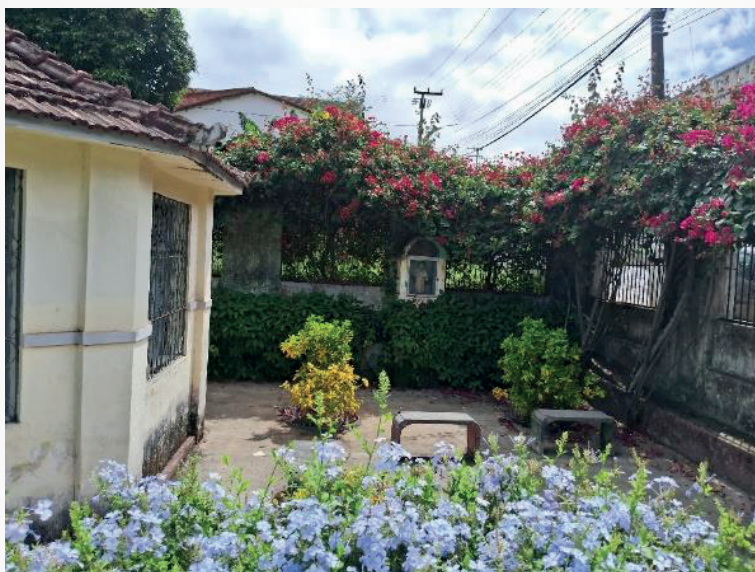
Figura 11 - Parte do belo jardim que existe antes de entrar nas edificações do Instituto Maria Imaculada.

A Figura 11 mostra parte do belo jardim que existe antes de entrar nas edificações do Instituto Maria Imaculada. No jardim junto ao muro do Instituto Mari Imaculada foi possível encontrar um pequeno santuário de um santo da Igreja Católica. No jardim existem diversos tipos de plantas que são muito bem cuidadas pelas Irmãs de Caridade.