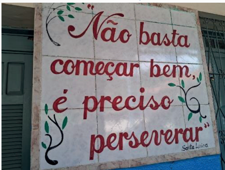
Figura 18 - Claustros nos corredores do colégio Instituto Maria Imaculada.