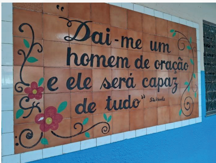
Figura 23 - Frase de São Vicente de Paulo sobre um revestimento cerâmico da parede.