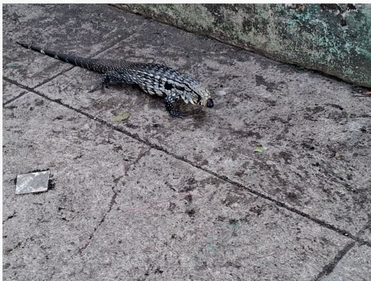
Figura 5 - Tejo que estava no jardim porque o Instituto Maria Imaculada.