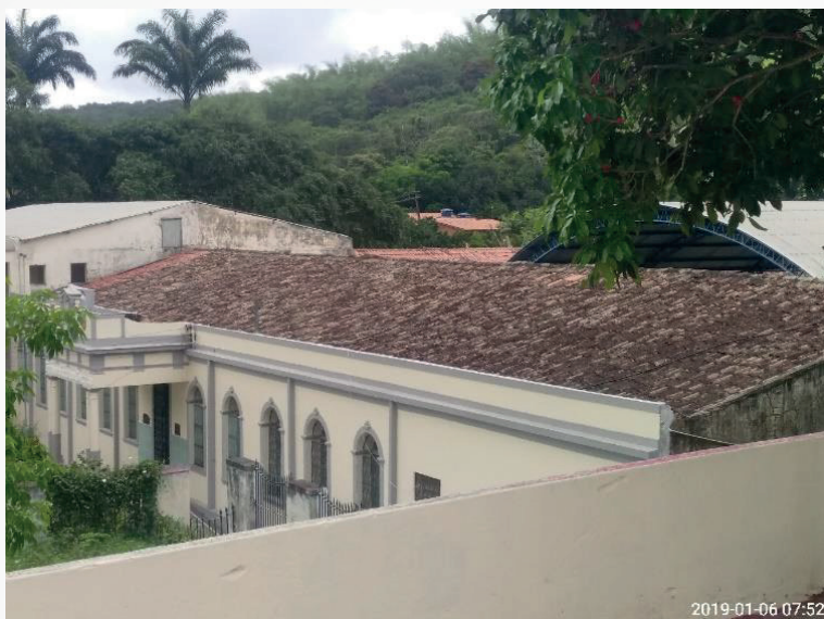
Figura 8 - O Instituto Maria Imaculada fica localizado dentro de um terreno de resquício do bioma da mata atlântica.

Na Figura 8 foi possível perceber que o Instituto Maria Imaculada fica localizado dentro de um terreno de resquício do bioma da mata atlântica, com várias árvores no seu entorno, principalmente na parte atrás do Instituto Maria Imaculada. Existe uma densa vegetação no sítio que pertence ao Instituto Maria Imaculada que fica atrás da instituição de ensino.