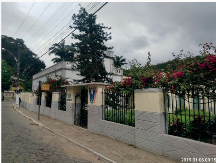
Figura 6 - Instituto Maria Imaculada no de 2023 com 91anos de existência.