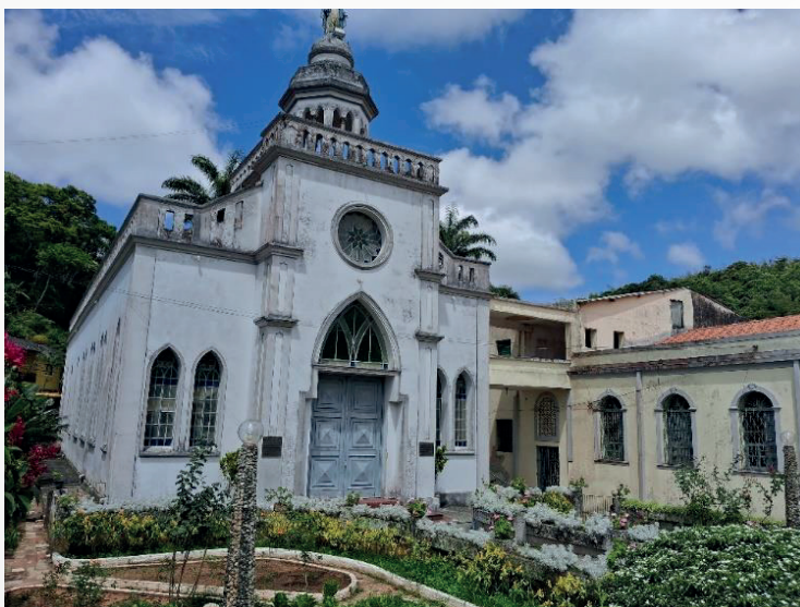
Figura 10 - Bela Capela de Nossa Senhora das Graças.

A Figura 10 mostra a fachada central da bela Capela de Nossa Senhora das Graças. Em frente a capela existe um bonito jardim e do lado direito fica localizado a edificação que foi pintada em cor amarela do Instituto Maria Imaculada localizado na cidade de Pacoti no Estado do Ceará.