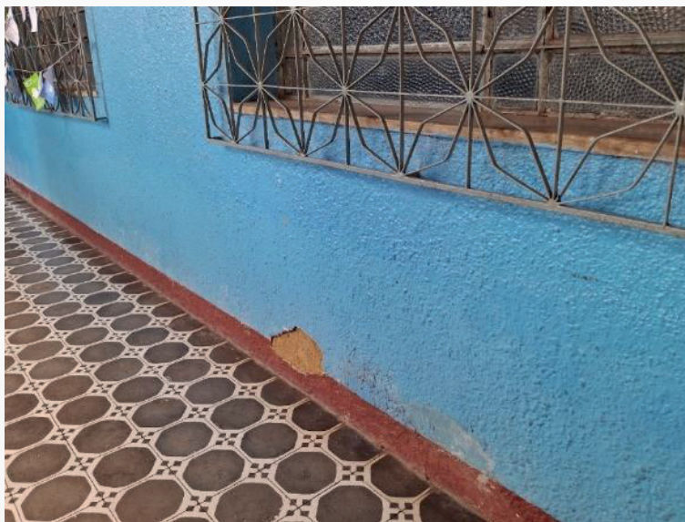
Figura 19 - Parte de um dos corredores da edificação nonde foi possível perceber que os mosaicos de revestimento do piso são muito antigos.