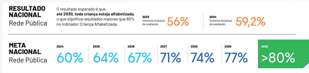
Figura 3: Indicador Criança Alfabetizada – Resultado Nacional.

Fonte: INEP. Disponível em: https://www.gov.br/inep/pt-br/areas-de-atuacao/avaliacao-e-exames-educacionais/avaliacao-da-alfabetizacao/resultados/2024 . Acesso em: 20 de set de 2025.