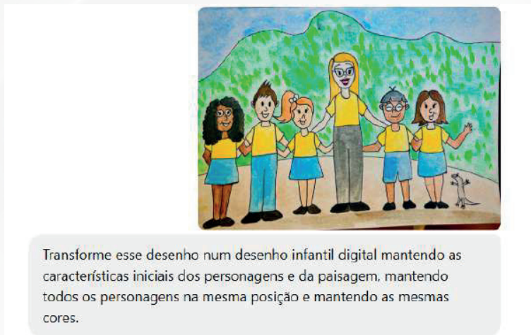
Figura 3 - Desenho original e prompt que deu origem à primeira versão digital dos personagens.