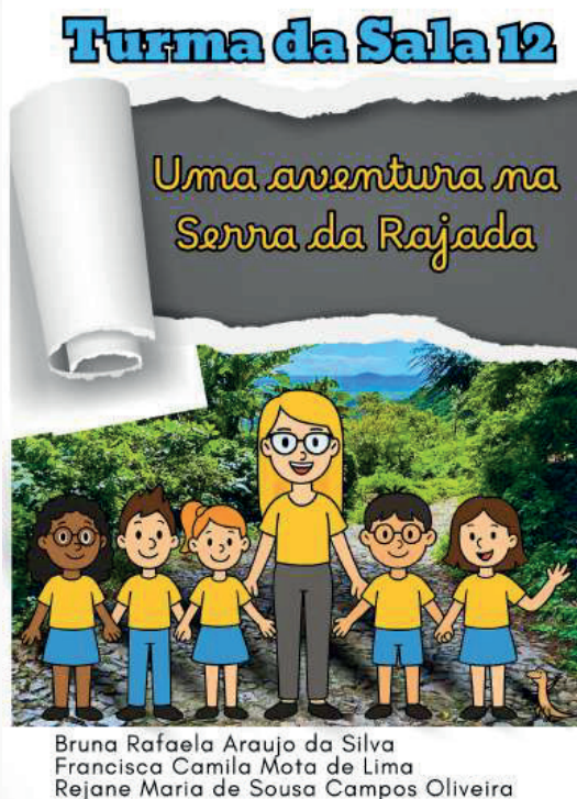
Figura 7 - Capa do livro Turma da sala 12: uma aventura na Serra da Rajada

imagens reais da comunidade. Os cenários do livro reproduzem paisagens autênticas da Serra da Rajada, fotografadas durante a pesquisa de campo, de modo que as crianças possam reconhecer visualmente o território e suas belezas naturais. Além disso, o livro inclui uma galeria fotográfica com registros da visita, constituindo-se também como documento histórico e educativo.