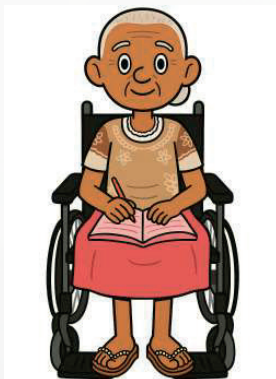
Figura 6 - Ilustração digital gerada a partir do desenho de Mãe Francisca

Os resultados gerados com a imagem de fotos, foram mais precisos que os desenhos gerados a partir das pinturas (Fig. 6). Alguns dos resultados necessitaram ser submetidos novamente para que fossem obtidos novos desenhos digitais que melhor se adequassem às ideias iniciais das autoras.