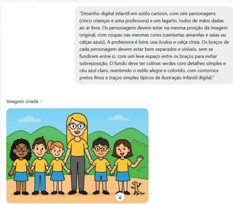
Figura 5 - Prompt que gerou os personagens em desenho digital e o resultado que viria a ser a versão final