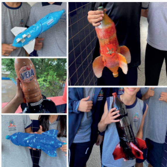
Figura 02 - Foguetes desenvolvidos pelos estudantes - Aula de Matemática.