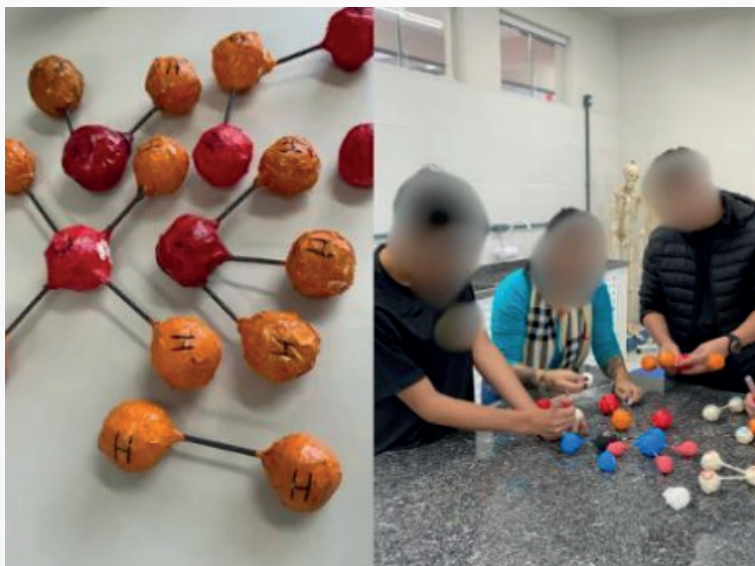
Figura 03 - Estudantes apresentando as moléculas que compõem a atmosfera do planeta escolhido.

Além dos conceitos físicos, foram explorados também os aspectos químicos relacionados à composição da atmosfera terrestre e dos demais planetas do Sistema Solar. Os estudantes analisaram os principais elementos e moléculas que compõem essas atmosferas, discutindo como essas diferenças interferem diretamente nas possibilidades de existência de vida e nas condições ambientais de cada planeta, gerando o produto final apresentado na Figura 03.