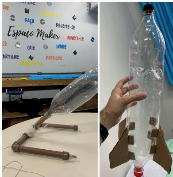
Figura 01 - Base de lançamento e foguete modelo.