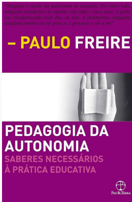
Figura 1 Livro Pedagogia da Autonomia

abordam sobre: “não há docência sem discência”, “ensinar não é transferir conhecimento” e “ensinar é uma especificidade humana”. Os três capítulos escritos por Freire, mencionam sobre desvincular o ensino mecânico e burocrático para um ensino, onde o aluno se torna autônomo e o professor como aprendiz.