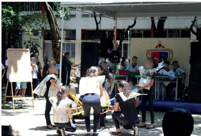
Apresentação cultural – 6º anos