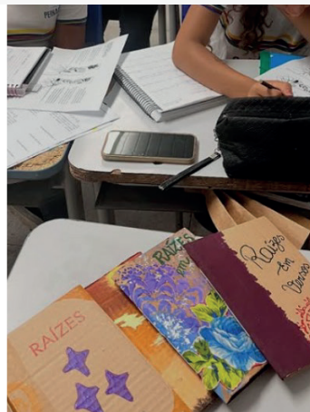
Figura 10: Realização das atividades com turma de EJA em uma das escolas