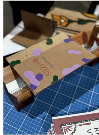
Figura 9: Imagem dos primeiros exemplares produzidos