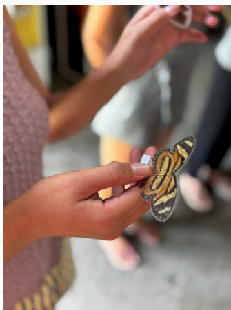
Figura 2: Dinâmica sobre você a partir de um objeto que te representa