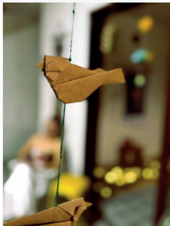
Figura 13: Símbolo de liberdade. Dobradura em exposição no ateliê de Eva Duarte

por opção das participantes, organizamos em círculo, com todas sentadas em almofadas no chão.