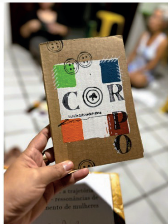
Figura 14: Exemplar do primeiro livro publicado pelas Cartoneras do Esperançar