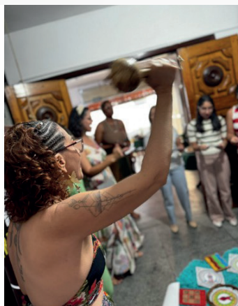
Figura 16: Terapia de Sarau, maio de 2025

Esta consciência da necessidade de expandir a ação a mais mulheres, levou o grupo a construir o Projeto Terapia de Sarau: a literatura em forma de remédio 9 , aprovado pela Lei Paulo Gustavo, por meio do qual realizaram 6 encontros abertos ao público feminino, nos meses de março, abril, maio, agosto, setembro e outubro de 2025. Durante os encontros acontecem momentos de reflexão a partir de leituras de obras produzidas por mulheres, partilhas de experiências, rodas de debates, cirandas, dinâmicas com músicas, coco de roda, entre outros. As pausas para o lanche - café, chá, sucos, salgados, doces e bolos - são momentos de interações entre as participantes, ao som de músicas que retratam a alegria e a potência dos encontros entre mulheres. As imagens a seguir, mostram um pouco daquilo que acontece.