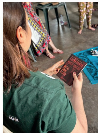
Figura 3: Dinâmica sobre você a partir de um objeto que te representa