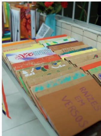
Figura 11: Alguns exemplares expostos durante o lançamento da obra no Sesc