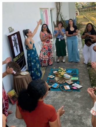
Figura 18: Terapia de Sarau, outubro de 2025