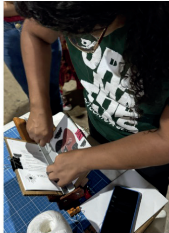
Figura 8: Montagem final sobre o primeiro exemplar