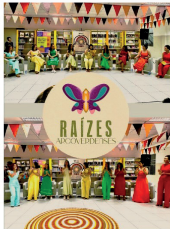
Figura 12: Imagens captadas durante o lançamento do livro Raízes Arcoverdes.