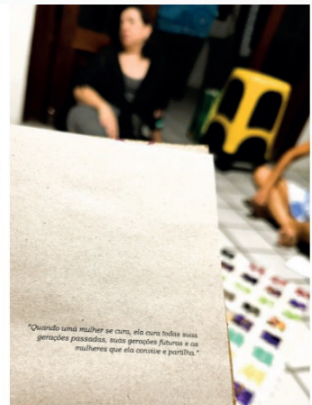
Figura 15: Epígrafe do livro Corpo - antologia do esperançar: mulheres costurando histórias