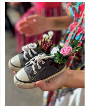
Figura 1: Dinâmica sobre você a partir de um objeto que te representa

As autoras assumem um estilo que, com base em Lobo (2019) pode ser classificado como uma literatura de autoria feminina. Seus versos evidenciam processos de resistência, empoderamento, sororidade e libertação, representados pelo cuidado, a união, a luta por justiça, etc. Vale ressaltar a força de suas escrituras, uma vez que materializam suas trajetórias enquanto mulheres, mães, filhas, esposas, profissionais, etc., conforme compartilharam durante as dinâmicas realizadas em alguns momentos da oficina, nos quais eram convidadas a falar sobre si, a exemplo do momento onde cada uma levou um objeto que a rerepresentasse e contou um pouco da sua história, conforme figuras 1, 2 e 3.