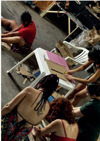
Figura 7: Etapa de recorte dos materiais para confecção das capas

as capas, como: tecidos, tintas, papéis coloridos, moldes vazados, flores e folhas naturais, entre outros, ia, aos poucos, revelando habilidades que muitas delas nem imaginavam possuir. As imagens 7, 8 e 9 são alguns registros do processo.