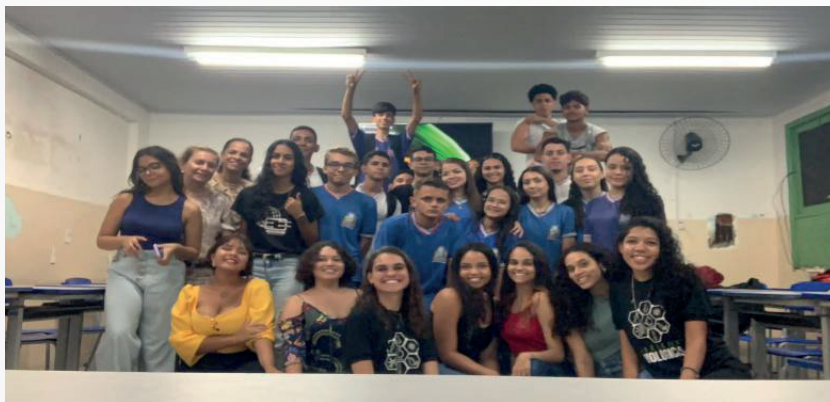
Figura 7 – Observação de aulas durante o período noturno (23/03/2024)

Tivemos a oportunidade de conviver com diversas turmas do primeiro até o terceiro ano, vivendo cada etapa do processo que é o ensino médio. Cada turma tinha suas particularidades e desafios que nós bolsistas observávamos para poder pensar em estratégias, juntamente com a professora, facilitando o processo de aprendizagem em biologia, conforme figura 7 e 8.