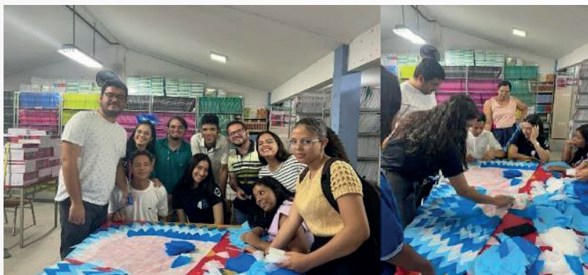
Figura 3 – Confecção das fantasias de Arara-azul-de-lear para o Projeto de Meio Ambiente em 2023

Ao longo da Iniciação à docência desenvolvemos diversas atividades, buscando envolver estudantes, professores, bolsistas, supervisores e todos aqueles que participam do contexto educacional. Além de produzir materiais didáticos, coparticipamos em sala de aula, fizemos projetos e desenvolvemos atividades, visando sempre o aprofundamento do letramento científico pelos educandos. Sendo assim, vivemos o ambiente escolar em sua inteireza e complexidade. A seguir trazemos algumas imagens de atividades desenvolvidas no colégio. Os bolsistas participaram do planejamento e execução das atividades para a semana do meio ambiente, conforme mostra a figura 3.