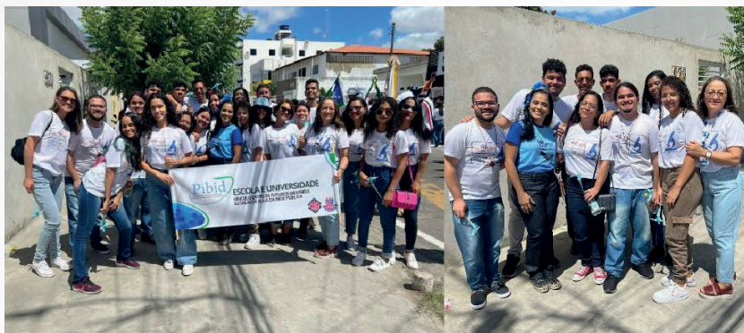
Figura 2 - Desfile de 7 de setembro em 2023

os bolsistas licenciandos e os alunos das escolas parceiras. Nesse projeto, a licenciatura focou nos elementos específicos de sua área através de um diálogo interdisciplinar, em que se buscou qualificar a formação pedagógica dos alunos bolsistas e gerar impacto também na formação continuada dos professores envolvidos. A figura 2 mostra uma atividade realizada com o grupo no desfile de 7 de setembro.