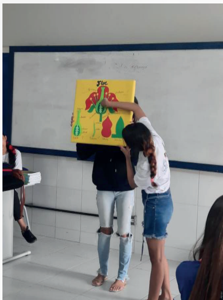
Figura 8 – Aula utilizando do material didático elaborado na UNEB-CAMPUS VIII