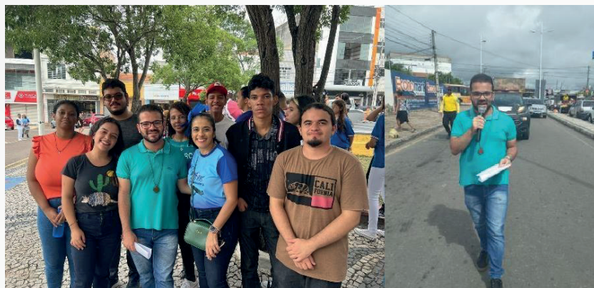
Figura 4 – Caminhada de culminância do projeto de meio ambiente (2023)

ao cantor local representando a cultura regional, como também, a participação junto com os discentes do Colégio Polivalente no Dia do Meio Ambiente Municipal no Memorial da CHESF, figura 4.