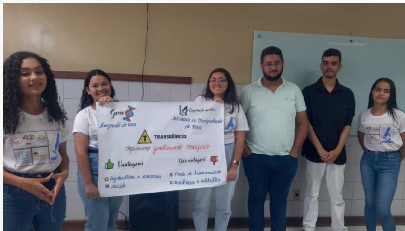
Figura 5 – Projeto sobre transgênicos elaborado pelos bolsistas realizados no dia 13 de setembro de 2023.

O comprometimento da comunidade escolar é algo que vale a pena pontuar, pois, pudemos observar um grupo de pais e responsáveis engajados nas atividades, e uma boa convivência e diálogo com o corpo docente e os estudantes. As reuniões de pais e mestres evidenciam isso, mostrando o comprometimento de todas as partes. As turmas sempre foram bastante engajadas e participativas, acolhiam com entusiasmo as atividades propostas e respeitavam todos os bolsistas. De início estavam um pouco envergonhados, mas logo se adaptaram e interagem de todas as formas. Outro ponto interessante é que por estarem no curso técnico em Análises Clínicas, as discussões e debates em sala sempre eram muito proveitosas, justamente por carregarem uma bagagem a mais dos conteúdos de Ciências da Natureza. Participamos de diversas atividades, trazendo algumas para ilustrar na figura 5.