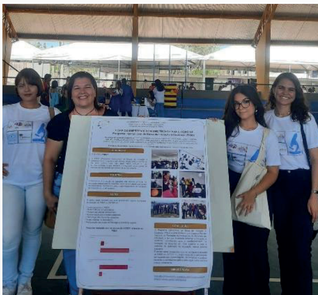
Figura 9 – Feira tecnológica do CETEPI-I