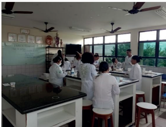
Figura 6 – Aula prática de microbiologia no Colégio Modelo Luís Eduardo Magalhães (13/09/2023)

Os bolsistas também tiveram a oportunidade de participar de uma aula prática no laboratório do Colégio Modelo Luís Eduardo Magalhães, conforme mostra a figura 6.