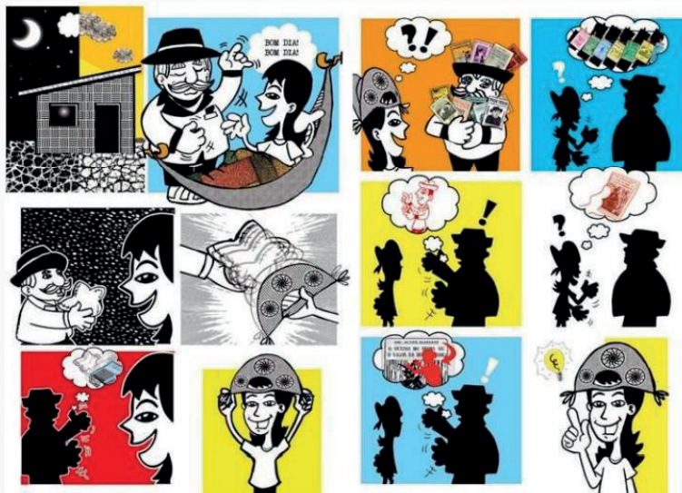
Imagem 07 - Trecho 6 - “Efetiva transmissão cultural”