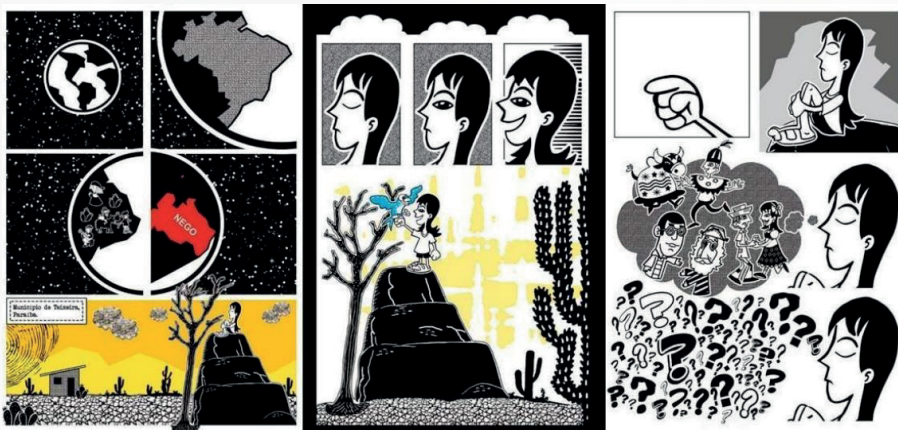
Imagem 02 - Trecho 1 - “A angústia pela incompreensão”

Fonte: Campos, Knapik e Potyguara (2022, p. 15-17).