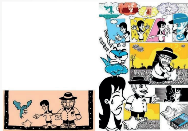
Imagem 05 - Trecho 4 - “A barreira linguística”