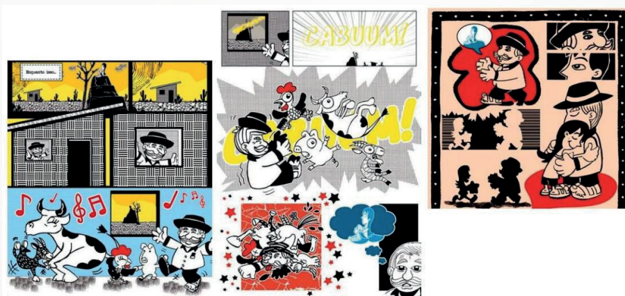
Imagem 04 - Trecho 3 - “O susto”