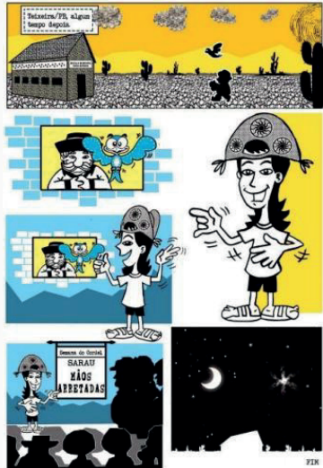
Imagem 08 - Trecho 7 - “Transmissão Transcultural”