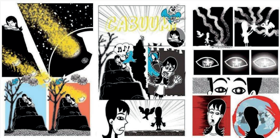
Imagem 03 - Trecho 2 - “O despertar mágico”