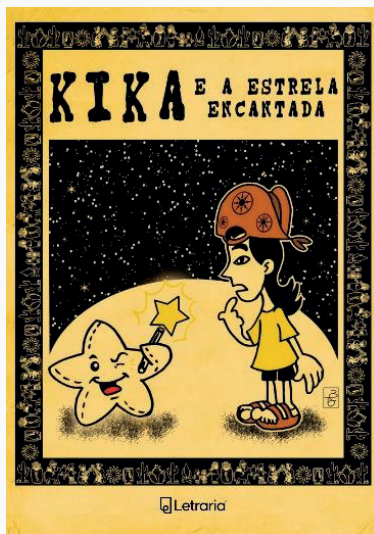
Imagem 01 - Capa do livro Kika e a estrela encantada

elaboraram todo o enredo da presente HQ. As ilustrações foram produzidas por Beto Potyguara, que é ilustrador e também um dos autores.