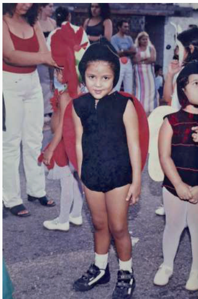
Figura 1. Autor, em meados dos anos 2000, em desfile do 7 de setembro.

Utilizando o recurso da imagem, termo que será constantemente abordado neste texto, a seguir, há um registro de um feixe de espaço-tempo simbólico da infância do autor, de um desfile de uma Comemoração da Independência do Brasil, no início dos anos 2000.