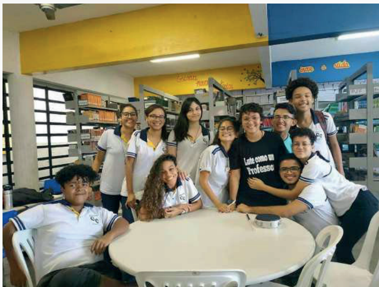
Figura 2. Grupo POESIE-SE! composto pelo autor e alunos da EEM Dr. César Cals.