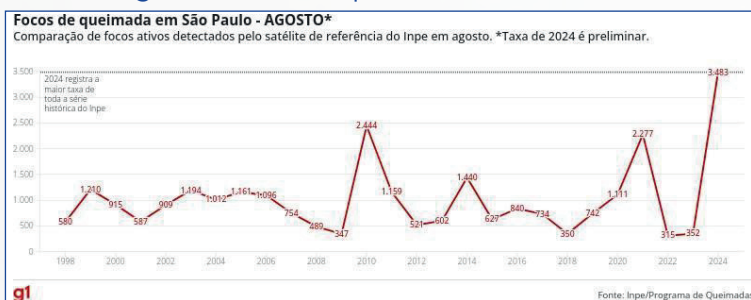
Figura 4: Focos de queimadas em São Paulo

A dupla que analisou São Paulo observou um aumento expressivo das queimadas em 2024, mas não realizou comparações com anos anteriores. Ao responder sobre as possíveis motivações para esse crescimento, os participantes indicaram que os eventos climáticos e a ação humana são os principais fatores, destacando que o ano de 2024 apresentou o maior número de queimadas da série histórica do INPE.