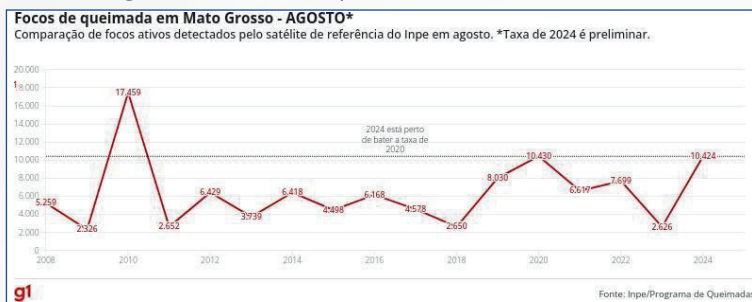
Figura 5: Focos de queimadas em Mato Grosso

do fogo para preparação do solo para o plantio, além do aumento das temperaturas, que intensifica a propagação das chamas.