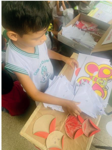
Imagem 03 – Criança interagindo com produções de escrita e leitura.

Fonte: Acervo Subprojeto Alfabrincar/PIBID-UFRA, 2025.