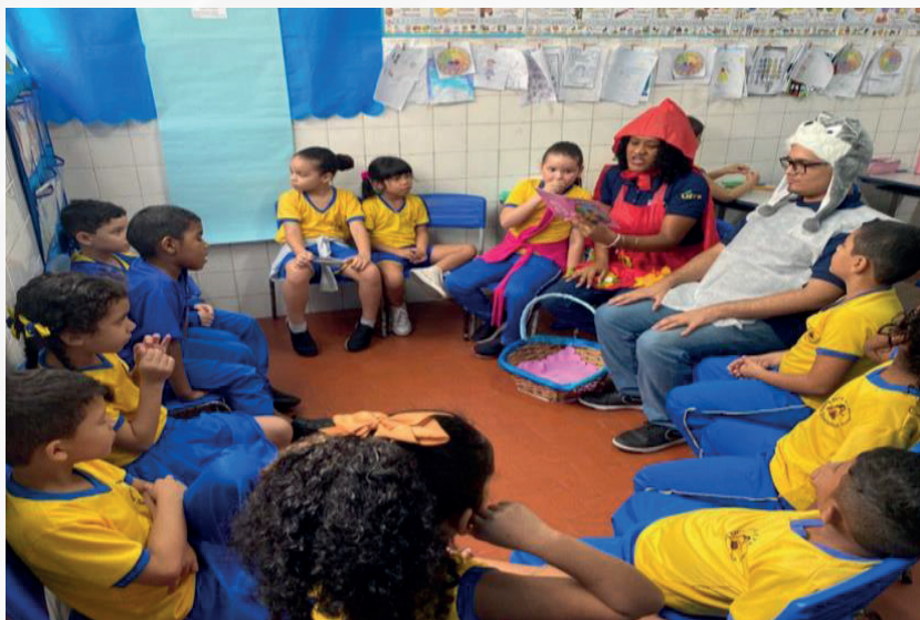
Imagem 01 – Círculo de contação de histórias

Fonte: Acervo Subprojeto Alfabrincar/PIBID-UFRA, 2025.