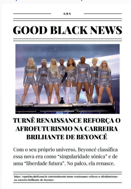
Figura 2. Exemplo de notícia positiva coletada pela estudante do curso de Linguagens.

Uma estudante do curso de Linguagens sugeriu que fossem desenvolvidas propostas pedagógicas que valorizassem e celebrassem a comunidade negra, indo além da abordagem centrada apenas nas dificuldades e nas violências históricas. Como exemplo, ela elaborou o projeto “Black Good News”, um jornal escolar voltado à divulgação de narrativas positivas e afirmativas sobre pessoas negras, com o objetivo de promover representações mais diversas, inspiradoras e emancipadoras dessa comunidade no espaço educativo.