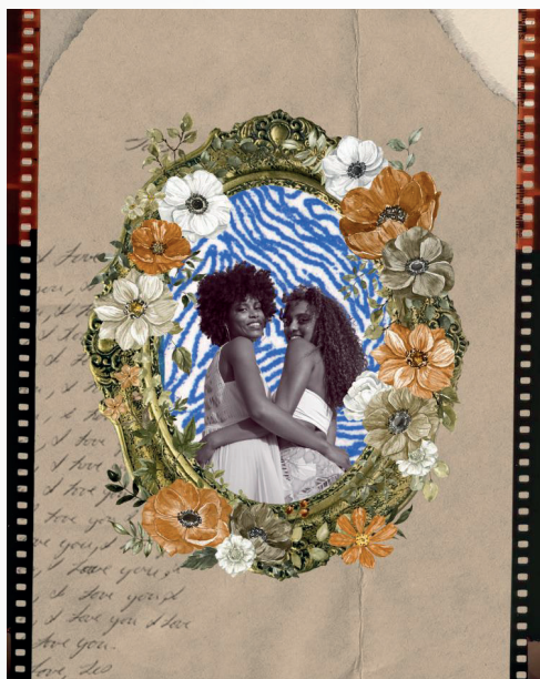
Figura 3. Colagem da estudante do curso de Linguagens com a temática do amor entre mulheres negras.

Intervenções como essa demonstram um processo formativo ativo, no qual o futuro professor assume o papel de pesquisador e criador de estratégias didáticas sensíveis à realidade dos estudantes. Em seus relatórios reflexivos, os licenciandos destacaram também a importância de preparar-se para lidar com conteúdos sensíveis – como o racismo – de modo responsável, ético e fundamentado teoricamente.