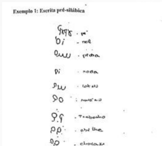
Imagem 1: Escrita pré-silábica

De acordo com os autores Leal e Moraes (2010, p.19), as representações acima são referentes a um adulto que “ainda não tenha compreendido a necessidade de realizar uma relação entre a pauta sonora da palavra oral e sua notação escrita.[...] não há indícios de uma preocupação”, complementam os autores.