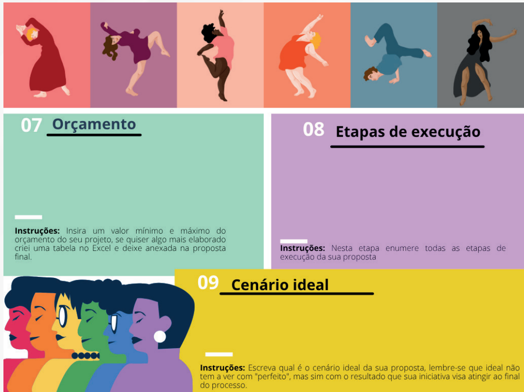
Figura 02: Continuação do Canva