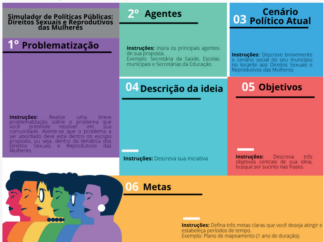
Figura 01: Canva de política pública - direitos em construção

Diante da breve revisão sistemática sobre o assunto, questiona-se como abordar essa temática em sala de aula. Primeiramente, destaca-se que disciplinas como Biologia, História, Filosofia e Sociologia são áreas centrais para esse debate, desde que a discussão não seja conduzida sob um viés biológico-naturalista, mas sim considerando aspectos históricos, sociais e culturais relacionados à construção do indivíduo ao longo de sua trajetória social. A seguir, apresenta-se, na íntegra, um Canva de política pública que discute os Direitos Sexuais e Reprodutivos a partir de sua inserção no debate público, estimulando a reflexão crítica e a participação cidadã dos educandos.