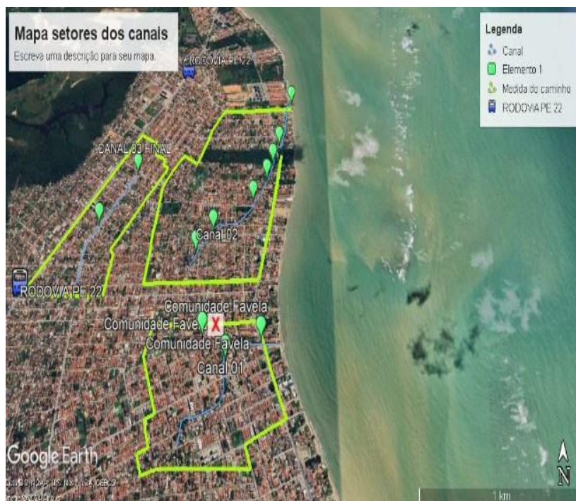
Figura 3: Mapa de localização dos canais.

Como salientado por Santos (2018), o envolvimento comunitário em processos de planejamento urbano é fundamental para garantir a eficácia das políticas públicas, especialmente em áreas de risco, como Pau Amarelo. A combinação de dados cartográficos e informações qualitativas permite uma abordagem mais abrangente e informada para o enfrentamento das inundações (Figura 3).