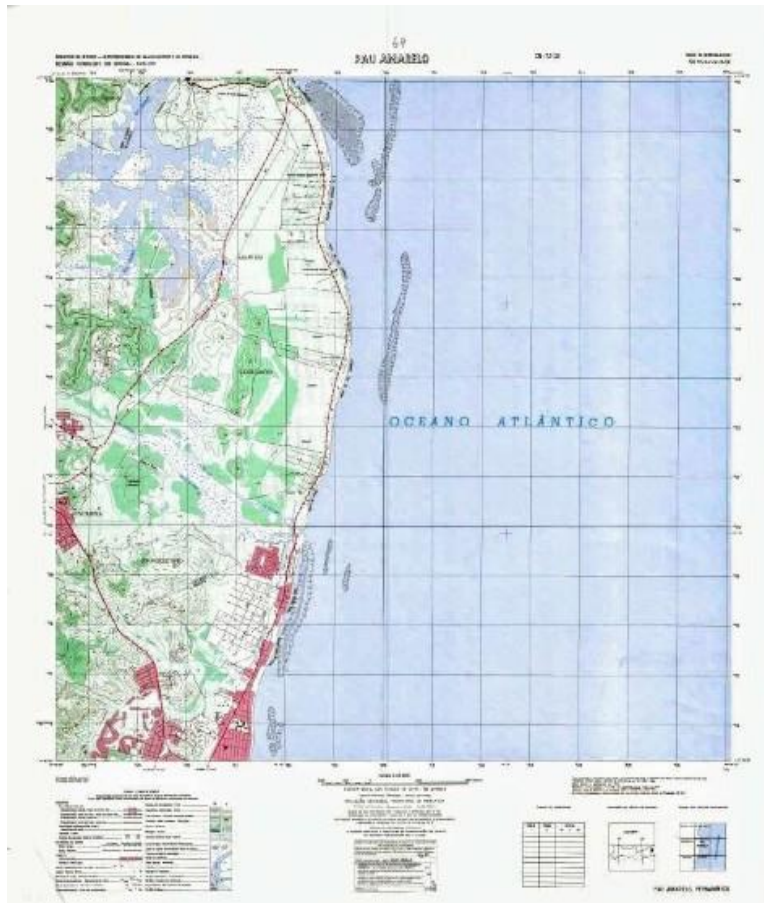
Figura 2: Carta Topográfica do bairro de Pau Amarelo, Paulista-PE

De acordo, com a carta Topográfica do ano de 1970 na sua legenda aponta locais de alagamento dentro do bairro, representando a configuração do bairro de Pau Amarelo e suas áreas de risco, possibilitando a visualização das áreas mais suscetíveis a alagamentos e inundações.