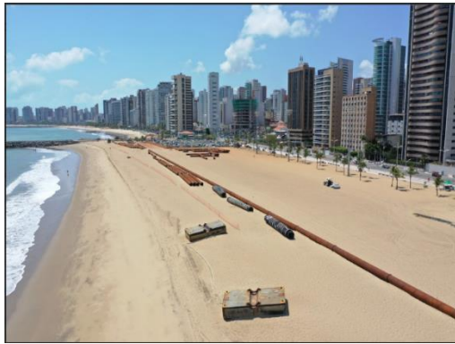
Figura 4 – Praia de Iracema (sentido Centro - costa leste)