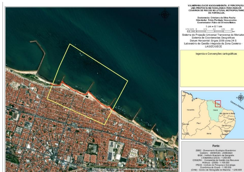
Figura 1 – Mapa de localização

Observa-se que a área de estudo se localiza no município de Fortaleza, litoral oeste, conforme se observa na Figura 1. Atualmente o município apresenta aproximadamente 2,4 milhões de habitantes e uma orla de aproximadamente 34 km de extensão.