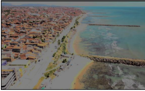
Figura 3 – Praia do Pirambu em Fortaleza