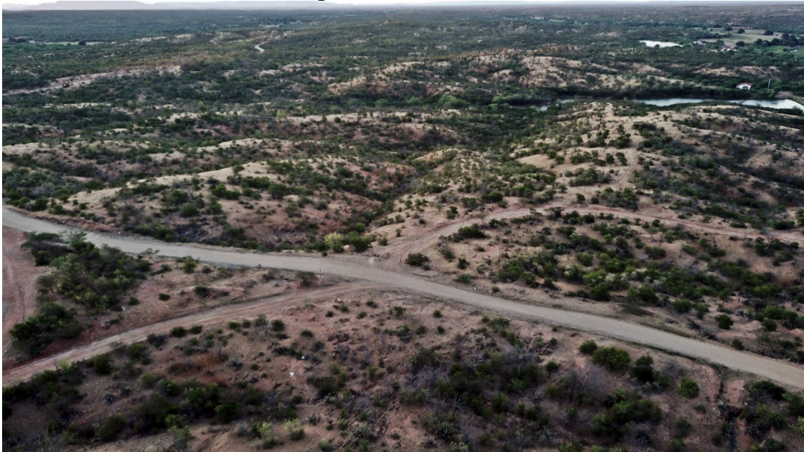
Figura 03: Vegetação de Caatinga Aberta no município de Ouro Branco-RN, inserida na bacia hidrográfica do Rio Barra Nova

A figura 03, por sua vez, evidencia a classe de Caatinga Aberta, dominante na paisagem da bacia, se configurando como uma caatinga arbustiva (<4,5m) composta por vegetação xerófila, com o processo de caducifolia marcando os períodos secos e chuvosos, com dominância das famílias Fabaceae, Anacardiaceae, Euphorbiaceae, dentre outras (SOUZA; ARTIGAS; LIMA, 2015; BFG, 2015; OLIVEIRA et al, 2017).