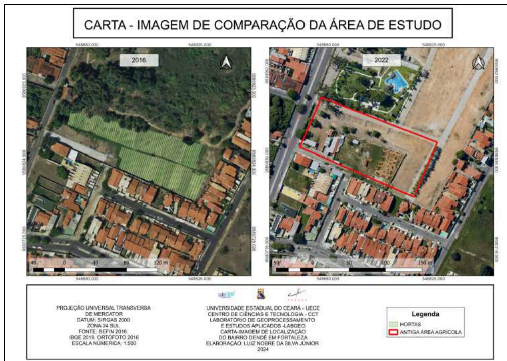
Figura 3 - Carta-Imagem de Comparação no bairro Dendê

Foram constatadas no bairro Parque Dois Irmãos em 2016 mais de 5000 glebas, ainda existentes no ano de 2022. Diferentemente do bairro Rachel de Queiroz (Dendê), onde foi descoberto que não existe mais nenhuma gleba hortícola, espaço esse que hoje é uma área de loteamento que futuramente será um condomínio residencial. (Figura 3).