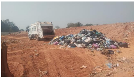
Fig. 01: Identificação da procedência do caminhão.

Inicialmente foi verificada a pertencência do caminhão a um dos municípios selecionados (Figura 01); a seguir, coletaram-se os resíduos sólidos misturados: da pilha depositada pelo caminhão eram amostrados cinco pontos, sendo: um no topo e quatro na base (frente, parte posterior, lateral direito e lateral esquerdo) (Figura 02).