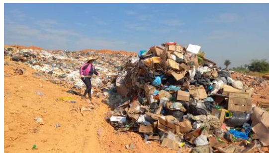
Fig. 02: Preparação para a coleta de resíduos misturados.

Logo após, os sacos e sacolas plásticas eram quebrados para homogeneizar as amostras, que eram depositadas em um tambor plástico com capacidade de 60 litros ( 0,06 \text{ m}^3 ) e peso de 1,44 Kg; uma vez que o tambor estiver cheio, era pesado na balança para determinar seu peso específico (densidade aparente) conforme a seguinte equação (Rezende et al., 2013):