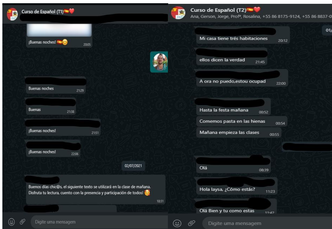
Imagem 2: Curso de extensão em espanhol – grupos das turmas 1 e 2