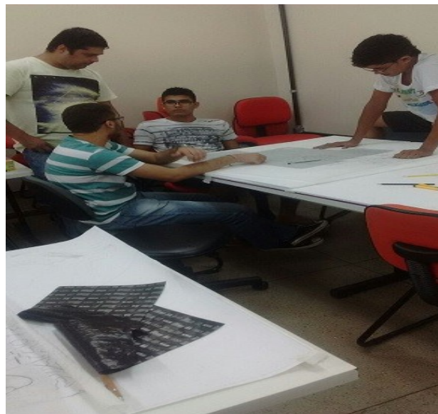
Figura 04: Maquete da micro criminosa em processo de