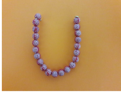
Figura 4 - Produção do autor.

Não tivemos dificuldade para a estudante perceber que a concavidade da parábola será voltada para cima quando a função for do tipo ax^2 + bx + c = 0 e voltada para baixo quando a função tiver a forma -ax^2 + bx + c = 0 . A participante conseguiu compreender também que o vértice da parábola poder ser localizado em qualquer quadrante, variando a posição da concavidade da parábola ser voltada para baixo ou para cima, podendo a mesma “cortar” qualquer um dos eixos ou ambos os eixos, conforme o valor do discriminante da lei da função.