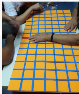
Figura 3 - Identificação dos pontos na reta numérica.

A princípio, percebemos a dificuldade de Carla compreender os eixos das abscissas e ordenadas; por isso, vimos a necessidade de aprimorar o material para suprir tal demanda. Também, identificamos a necessidade de retomar com a mesma, a localização de pontos na reta numérica, a fim de auxiliar a mesma na localização e identificação de pontos no plano cartesiano, como indicado na figura 3.