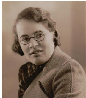
Figura 1: Joan Clarke