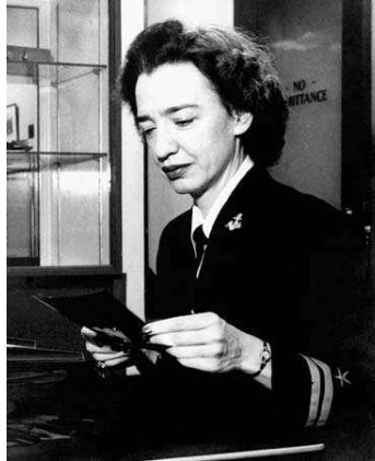
Figura 2: Grace Hopper