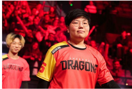
Figura 4: Kim “Geguri” Se-yon