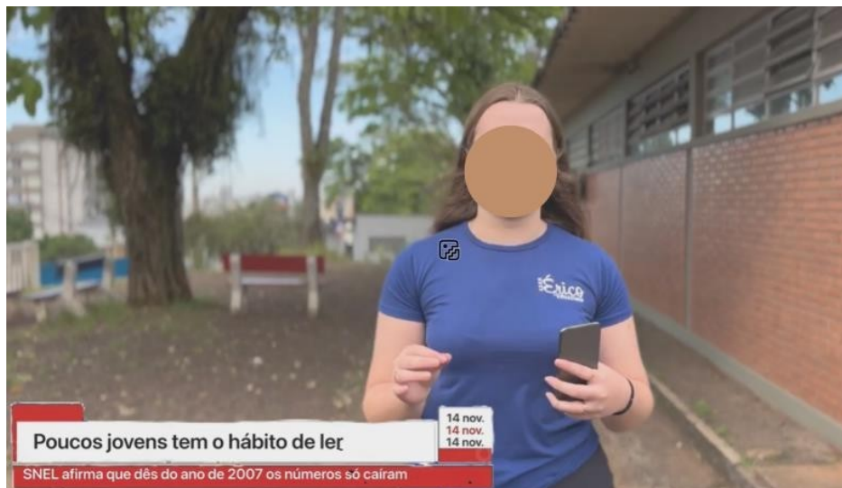
Imagem 3 - Produção de reportagem em formato de vídeo pelos estudantes.

A importância de levar o universo das redes sociais para o debate pedagógico ficou evidente quando analisamos notícias no Instagram, por exemplo. Essa estratégia é o cerne dos multiletramentos defendidos por Rojo e Moura (2012), em que se parte das linguagens e mídias conhecidas pelos alunos para buscar um enfoque crítico e ético. Na sequência, a produção de reportagens audiovisuais utilizando o celular desafiou os estudantes a adaptarem a linguagem escrita para o vídeo, planejando roteiros, entrevistas, locais de filmagem e observando as diferenças entre as palavras escritas e as palavras faladas. Durante a atividade prática, os grupos entrevistaram colegas e demais estudantes do educandário sobre seus maiores sonhos e planos para o pós-escola, o que corroborou com a continuação do debate sobre o mercado de trabalho e também transformou a insegurança e angústia dos estudantes.