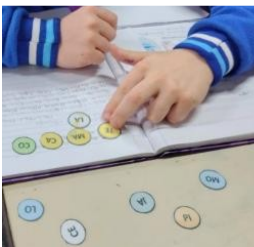
Figura 1: Atividade com sílabas soltas

sílabas soltas, em que cada aluno deveria formar palavras e, em seguida, registrá-las no caderno. No início, muitos demonstraram insegurança e dificuldade, buscando constantemente nossa ajuda para conseguir realizar a atividade. Para facilitar o processo, oferecemos uma sílaba inicial como apoio, incentivando que eles encontrassem as demais por conta própria. Com o incentivo contínuo, a insistência positiva e o encorajamento, foram possíveis perceber que, aos poucos, os alunos passaram a realizar a atividade com mais confiança e autonomia, demonstrando avanços em sua aprendizagem.