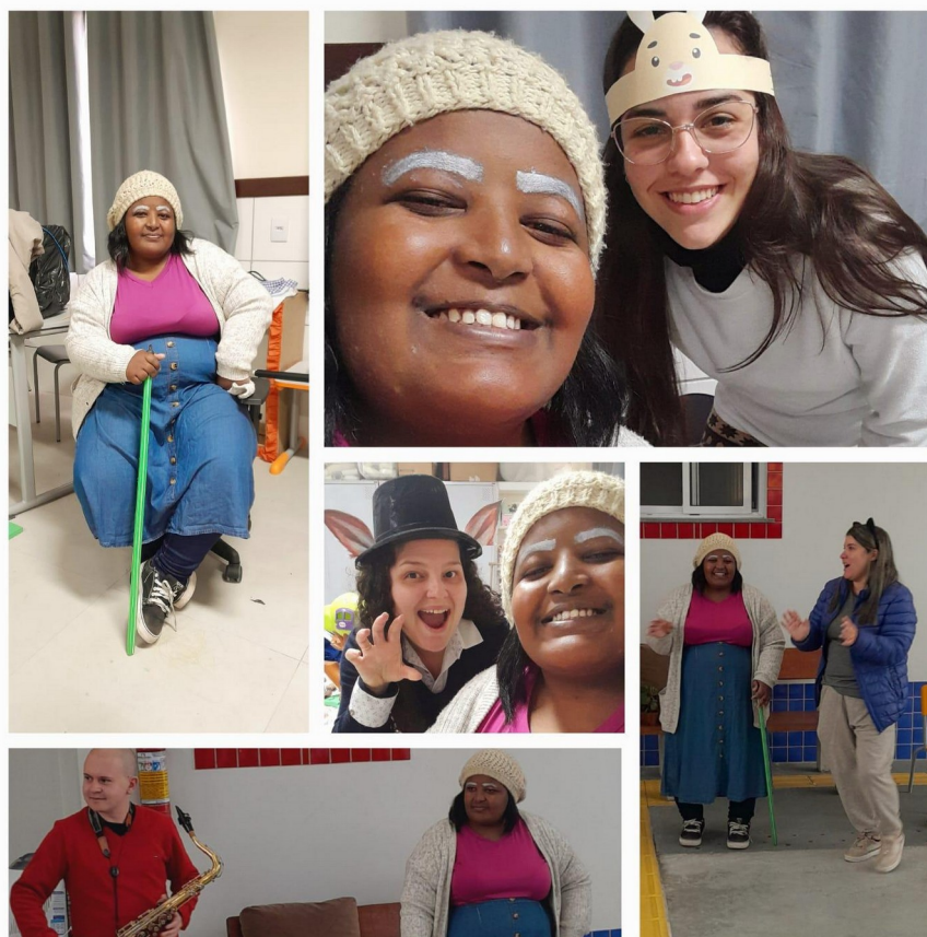
Imagem 2: Proposta “O caso do bolinho”.

Percebo que essa história sonorizada foi uma experiência significativa, mas as crianças não queriam que a raposa tivesse comido o bolinho no final, trazendo outras possibilidades a partir do imaginário infantil.