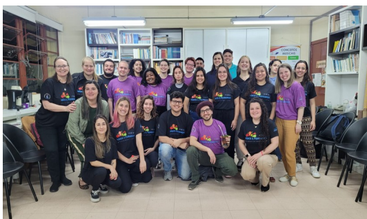
Imagem 4: Grupo do Pibid Interdisciplinar Música e Pedagogia.

Além disso, destaco a importância das reuniões gerais, tanto as realizadas com a supervisora, quanto as realizadas com o grupo completo junto às coordenadoras do núcleo. Nesses momentos podemos socializar as experiências e construir aprendizados por meio dos planejamentos, dos registros e das vivências musicais.