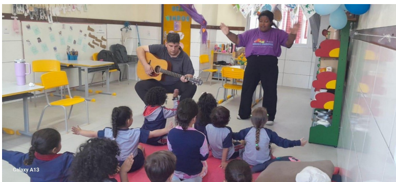
Imagem 3: Proposta “A roda do ônibus”.

Além das duas propostas mencionadas, trabalhamos com a canção “A roda do ônibus”, do Folclore Popular. Teve por objetivos estimular a expressão corporal, ampliando a participação das crianças por meio da imaginação. Nesta proposta, enquanto meu colega de dupla cantava e tocava o violão, eu cantava e fazia os gestos com as crianças usando o próprio corpo, como, por exemplo: imitando a porta abrindo e fechando, o som da buzina, os passageiros subindo e descendo, o som do bebê e da mamãe. E depois convidamos as crianças para refletir o que elas poderiam fazer dentro do ônibus, uns pulavam, outros dançavam, estalavam os dedos. Esse foi um momento de criação, em forma de pequena composição sonora a partir da música trabalhada.