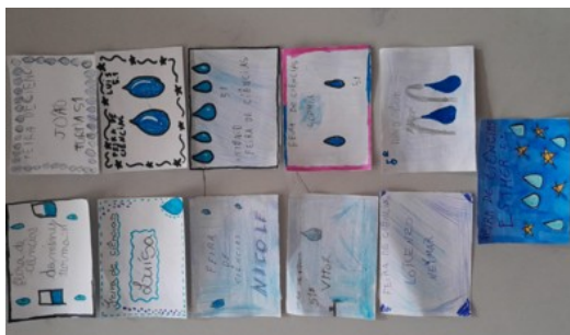
Figura 4 – Crachás

Apesar do contexto de vulnerabilidade socioeconômica, a turma demonstrou expressiva colaboração na coleta de materiais recicláveis para a construção da maquete, sendo os itens complementares providenciados pelas bolsistas do Pibid. Também foram elaborados materiais de apoio para a apresentação, como crachás (Figura 4) e cartazes (Figuras 5), elementos decorativos e impressos com informações sobre o trabalho.