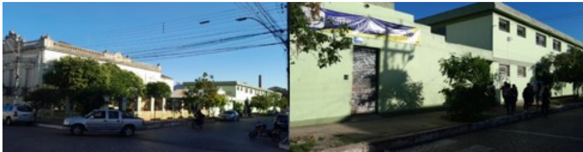
Figura 1 - Colégio Estadual Félix da Cunha.

O Colégio Estadual Félix da Cunha (Figura 1) está localizado no centro, próximo à região portuária da cidade de Pelotas, estado do Rio Grande do Sul. A instituição, com mais de cem anos de história, oferece Ensino Fundamental e Médio. O educandário funciona em um prédio histórico, originalmente pertencente à família Ribas, contando também com um anexo mais recente que complementa sua estrutura física. Na Figura 2 é apresentado o logotipo atual da instituição.