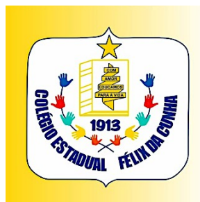
Figura 2 – Logotipo do Colégio.