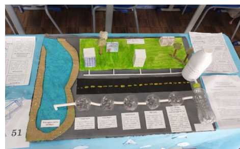
Figura 11 – Maquete ETA.