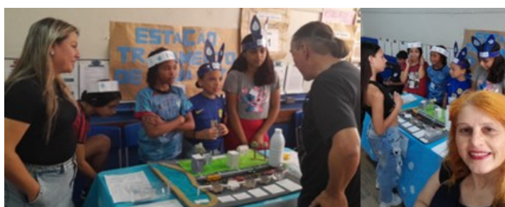
Figura 10 – Feira de Ciências.

Durante a realização da Feira de Ciências (Figura 10), observou-se que os estudantes apresentaram segurança ao explicar o funcionamento da maquete (Figura 11) e responder às perguntas dos avaliadores e visitantes. A atividade demonstrou que a participação em projetos investigativos e em eventos científicos escolares pode contribuir significativamente para o desenvolvimento da autonomia, da expressão oral e do pensamento científico dos estudantes.