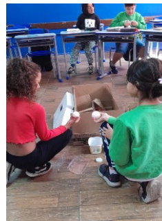
Figura 7 – Atividades.