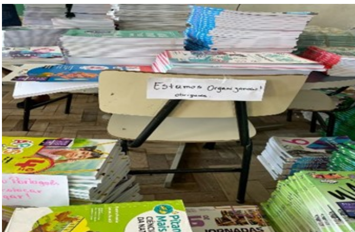
Imagem 2 - Organização da Sala de Leitura.

acontecimentos, não sendo suscetíveis de quantificação. Abaixo uma imagem mostrando o processo de organização: