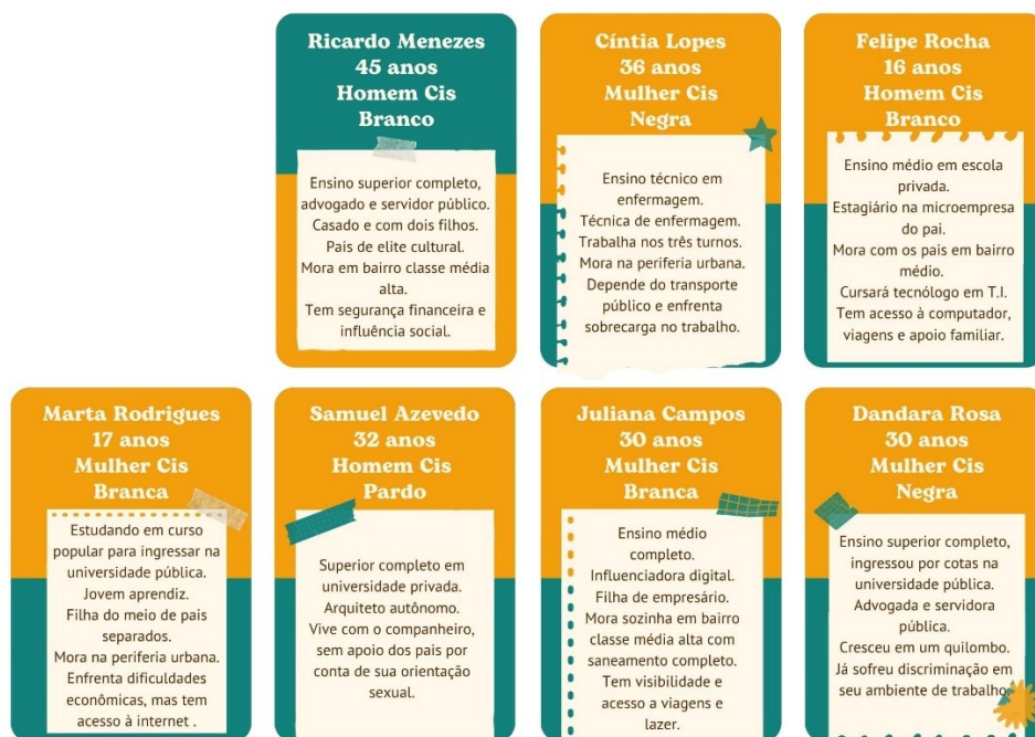
Figura 2: Cartas do Jogo

A análise dos perfis evidencia que personagens como trabalhadoras da saúde submetidas a jornadas intensas, moradores de periferias com acesso precário a serviços públicos ou jovens com responsabilidades familiares precoces apresentam sistematicamente menores possibilidades de avanço, em contraste com perfis associados a estabilidade econômica, capital educacional elevado e redes de apoio consolidadas. Tal diferenciação não apenas ilustra desigualdades, mas explicita sua lógica de funcionamento.