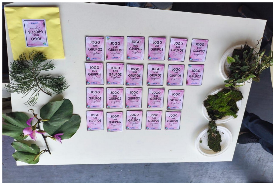
Figura 2 - Jogo da Memória sobre os Grupos Vegetais para participação na Feira do Livro de Alegrete - RS.