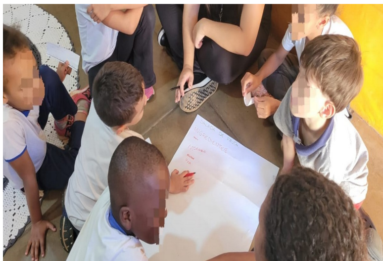
Figura 03 – Práticas coletivas - educativas e afetivas

Lima (2002) destaca que o vínculo social e afetivo constitui elemento fundamental no processo de alfabetização, pois a aprendizagem não se dissocia das dimensões emocionais.