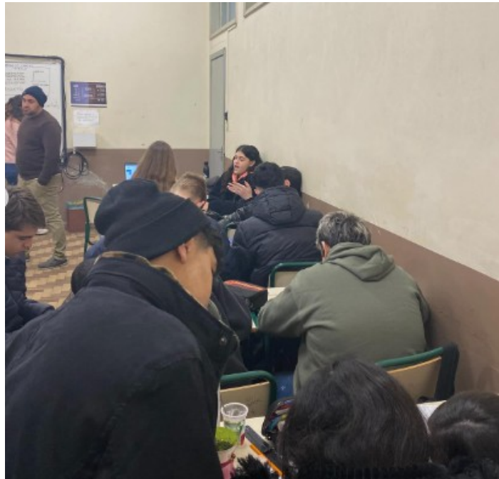
Figura 2 – Estudantes discutindo em grupo sobre o trabalho proposto