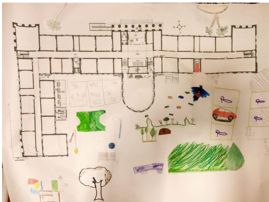
Figura 2 - Mapa Vivencial da Turma Y