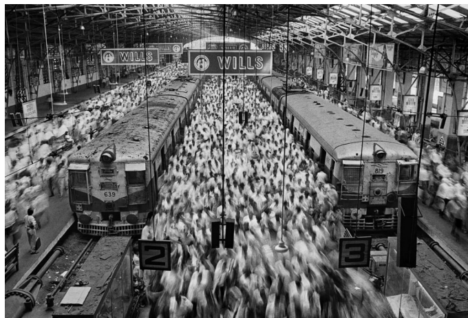
Imagem 02 – Mumbai, 1995.

Diante disso, questionou-se os alunos o porquê da movimentação, se haveria alguma intenção contida nela ou se acreditavam ter sido apenas um erro bonito e, se sabendo que foi intencional, quais mensagens procurou-se transmitir. Ao que o movimento nos remete dentro deste contexto, como o espaço se relaciona com esse movimento e quem são esses que se movimentam? Não é possível identificá-los e, se não é, por quê? Que lugar essas pessoas ocupam quando se encontram como massa em movimento sem identidade, elas parecem relevantes ou se perdem como mais um na multidão? Indagando aos alunos quem seriam aquelas pessoas e se conseguem estabelecer um paralelo entre elas e o contexto brasileiro ao qual se encontram. Deixando ao final a proposição de produzir algo similar ao efeito da imagem em outro momento, caso tenham se interessado e queiram experienciar mais da fotografia.