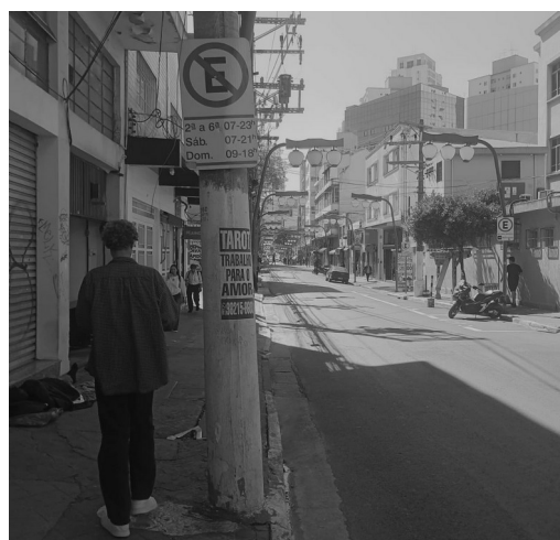
Imagem 01 – Bairro da Liberdade, São Paulo, 2025.

A desapropriação de uma comunidade em benesse de outra demonstra os princípios morais regidos por determinada sociedade, que credita ou não sujeitos de acordo com seus valores. Pensando nisso, questiona-se os alunos sobre a presença da pessoa em situação de rua na foto e se essa foi um ponto de destaque para eles e, se não, por quê? Examina-se a posição a qual essa pessoa se encontra na imagem e a relação semiótica que tal posicionamento angular estabelece, pois da mesma maneira que ela é colocada à margem aqui, ela se encontra a margem dentro do cenário social. Trazendo questionamentos sobre quem a põe nesse lugar de marginal e se inconscientemente não acabamos por consentir com essa ação, ao banalizar essas ocorrências.