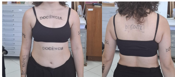
Imagem 1- Marcas Docentes

Supervisionado, com o desenvolvimento de um projeto artístico pensando nas “marcas docentes” 5 deixadas em mim e por mim (Imagem 1). Com isso, esse questionamento se estendeu em pensar nas produções artísticas de professores de arte na rede de ensino pública de Florianópolis (SC) como um ato de resistência política às demandas exaustivas relatadas por esses profissionais, e como essas produções se encaixam em suas práticas docentes. A partir disso, estão previstas entrevistas com professores para o aprofundamento do tema e o desenvolvimento de carimbos com palavras que esses professores caracterizam a docência, a fim de explorar mais a ideia das “marcas docentes” comentada anteriormente.