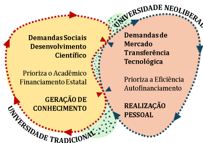
Figura 1. Representação do modelo de Contexto Emergente da Educação Superior.

O conceito de contexto emergente da Educação Superior é abrangente e comporta múltiplas interpretações; neste estudo, porém, é compreendido a partir das demandas que incidem externamente sobre o espaço universitário. Essas demandas decorrem de políticas globais, transformações tecnológicas associadas ao mundo do trabalho e políticas de democratização do acesso e permanência de novos públicos nas instituições de ensino, frequentemente originadas fora da tradição acadêmica e que exigem revisão das práticas institucionais. Nesse sentido, o contexto emergente configura-se como um espaço de transição entre dois modelos teóricos distintos (o tradicional e o neoliberal), com características e implicações próprias, conforme discutido por Morosini (2014), apoiada em Espinoza e Gonzalez (2012) e Didriksson (2012), conforme representado na Figura 1.