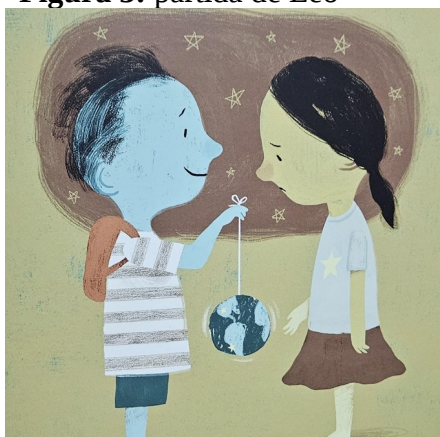
Figura 3: partida de Léo