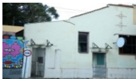
FIGURA 2 - FACHADA DA SOCIEDADE 13 DE MAIO