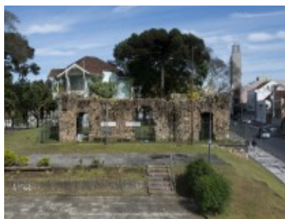
FIGURA 3 – RUÍNAS DE SÃO FRANCISCO

Além disso, o Alto de São Francisco esteve associado ao sepultamento de grupos marginalizados, como pessoas escravizadas e pobres, evidenciando uma organização espacial que expressava hierarquias raciais e sociais. Assim, as Ruínas configuram-se como uma paisagem de resistência e memória negra, tensionando a narrativa embranquecida da formação de Curitiba e revelando as desigualdades estruturais do período colonial e seus desdobramentos.