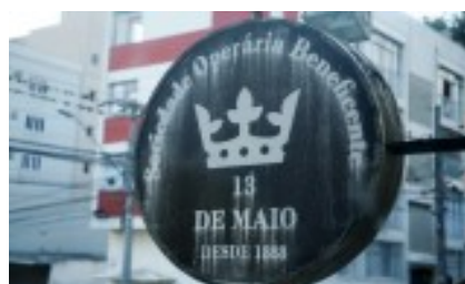
FIGURA 1 – SIMBOLO DA SOCIEDADE

Fundada em 1888 por negros libertos e trabalhadores livres ligados à Irmandade de São Benedito, a Sociedade Operária Beneficente Treze de Maio nasceu no contexto imediato da abolição da escravatura. Criada como uma instituição de apoio social, oferecia auxílio médico, funeral, educativo e comunitário para ex-escravizados que eram abandonados à própria sorte pelo Estado e pela elite branca. Localizada no Boulevard São Francisco, foi também espaço de encontros culturais, bailes e festas, tornando-se referência para a sociabilidade negra em Curitiba. Hoje, resiste como unidade de interesse especial de preservação, simbolizando a luta do associativismo negro contra a exclusão social e a marginalização. (Pitz, 2022).