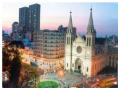
FIGURA 10 – Praça Tiradentes com a Catedral Basílica Nossa Senhora da Luz dos Pinhais.

A Praça Tiradentes é o marco zero da cidade. Mas, para a população negra, as gameleiras que existiam no local eram mais do que árvores: eram lugares de sociabilidade, descanso e de sacralidade. Na cosmovisão afro-brasileira, a gameleira é árvore sagrada, ligada a orixás como Iroko (Prefeitura Municipal de Curitiba, 2024). Em 2017, foi instalada uma placa reconhecendo o espaço como sagrado e afirmando: “A raiz negra em Curitiba é forte, antiga e ativa”. Hoje, o local é ponto de cortejos da Festa do Rosário e de manifestações culturais afro-brasileiras, mostrando como a memória negra resiste e se re-inscreve no coração da cidade. (Informativo Centro Cultural Humaitá, 2019).