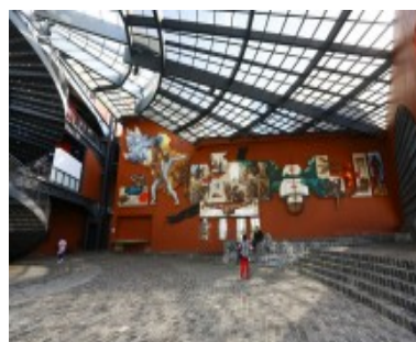
FIGURA 7 – PAINEL PRODUZIDO POR SÉRGIO FERRO