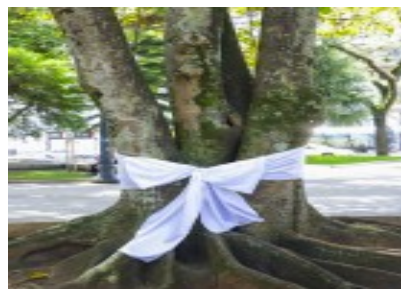
FIGURA 11 – Gameleiras da Praça Tiradentes