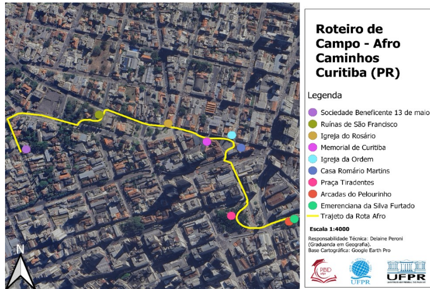
FIGURA14 – MAPA ROTEIRO DE CAMPO – AFRO CAMINHOS CURITIBA

distribuição dos locais analisados, apresenta-se, a seguir, o mapa da Rota Étnico-Racial.