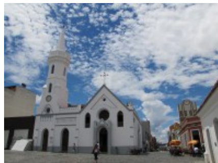
FIGURA 9 – IGREJA DA ORDEM