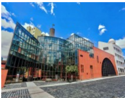
FIGURA 6 – FACHADA DO MEMORIAL DE CURITIBA

O painel artístico de Sérgio Ferro, também inaugurado em 1996, apresenta uma visão tradicional da história do Brasil e de Curitiba, destacando símbolos associados ao progresso e à fundação da cidade. Embora a presença negra apareça na obra, ela é representada de forma estereotipada, com homens em posição de submissão e mulheres hipersexualizadas, evidenciando a reprodução de perspectivas coloniais e racistas na construção visual da memória histórica.