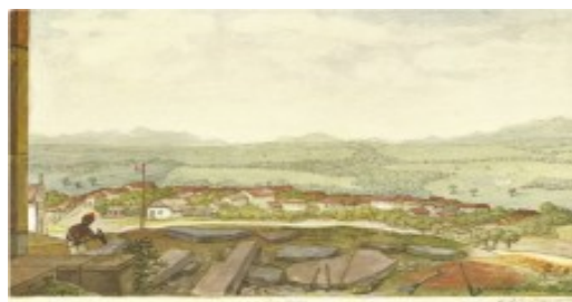
FIGURA 4 – ALTO DO SÃO FRANCISCO - Jean Babtist Debret, 1827.

O quadro de Debret, retrata um mestre de taipa atuando entre as ruínas, ao mesmo tempo em que oferece uma visão panorâmica da cidade no início do século XIX.