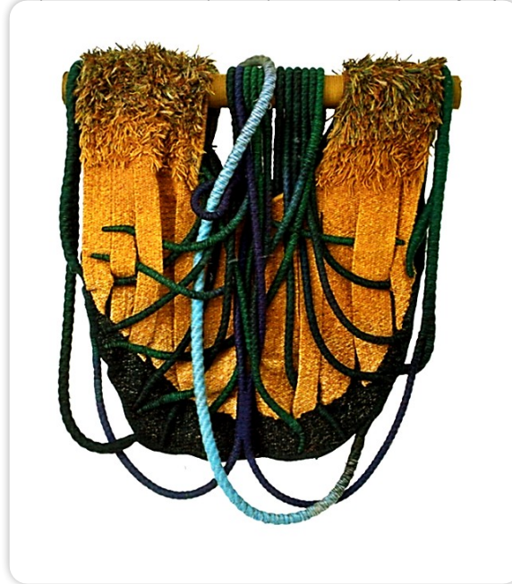
Imagem 1 – Terras fértil, Norberto Nicola, 1983, 160x150 cm, Coleção particular, São Paulo, SP

É o caso da composição Terras Fértil 8 de 1983, que se apresenta em forma semioval dupla, formando uma espécie de bolsa, composta por tiras tecidas, perpassada por vários cordões e sustentada por uma base superior cilíndrica aparente. Forma essa que difere da retangular ou quadrada predominante nas tapeçarias tradicionais.