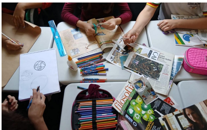
Imagem 1- Alunos elaborando sua colagem

Abaixo, ilustra-se uma etapa da realização da atividade (imagem 1) e cartazes apresentados pelos alunos (imagem 3, 4, 5 e 6)